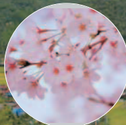
かみごおりさくら園